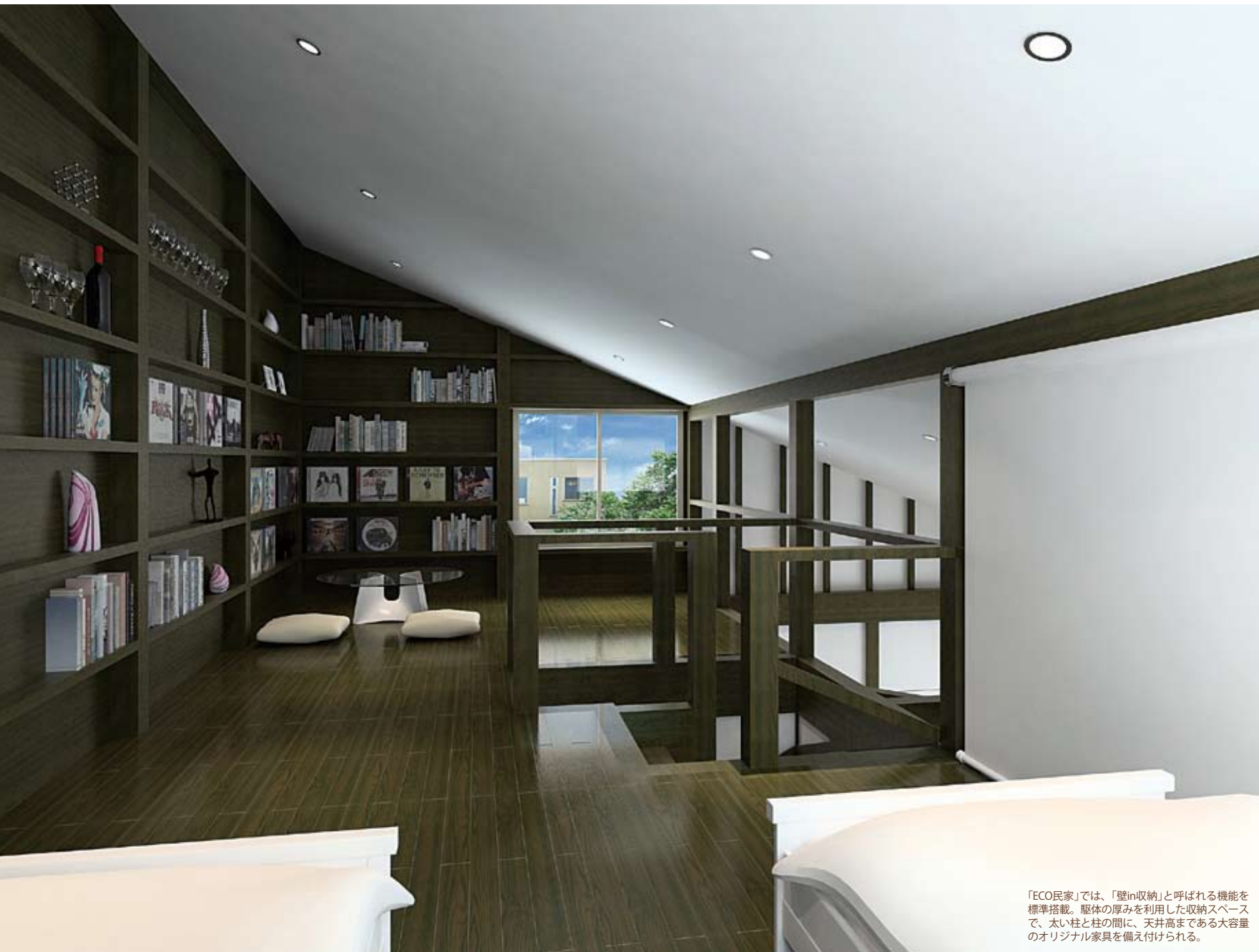
「ECO民家」では、「壁in収納」と呼ばれる機能を標準搭載。壁の厚みを利用した収納スペースで、太い柱と柱の間に、天井高まである大容量のオリジナル家具を備え付けられる。