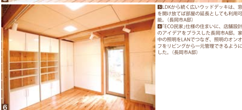
5 LDKから続く広いウッドデッキは、窓を開放すれば部屋の延長としても利用可能。(長岡市A邸) 6 「ECO民家」仕様の住まいに、店舗設計のアイデアをプラスした長岡市A邸。家中の照明をLANでつなぎ、照明のオンオフをリビングから一元管理できるようにした。(長岡市A邸)